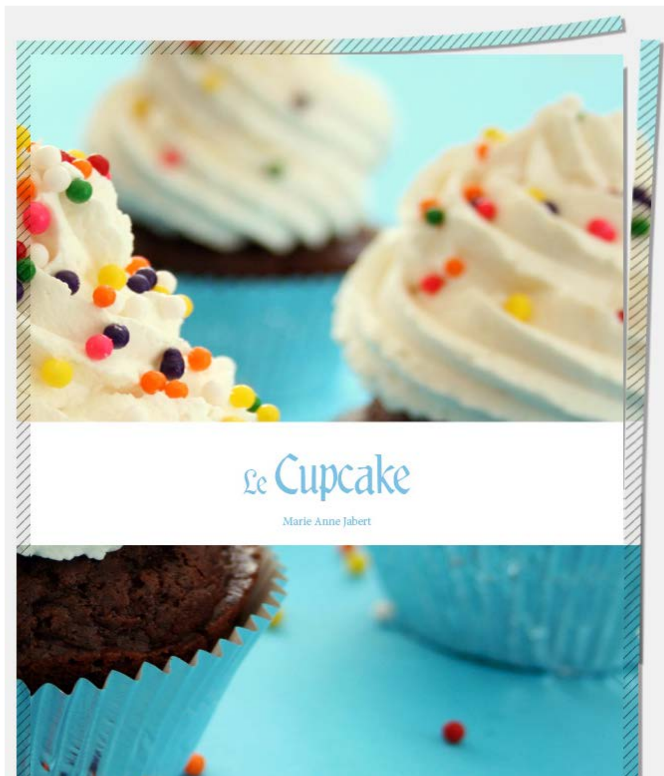
Exemple d'un document avec fond perdu. La partie hachurée est coupée.

Le fond perdu représente l'espace situé à l'extérieur de la page, dans lequel dépassent les couleurs et photos qui doivent aller jusqu'au bord du papier dans la version finale.